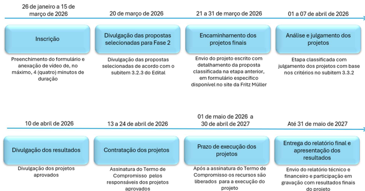
Figura 1 – Fluxograma das atividades do Edital

O cronograma deste Edital, detalhado na Figura 1, constitui-se das seguintes etapas: