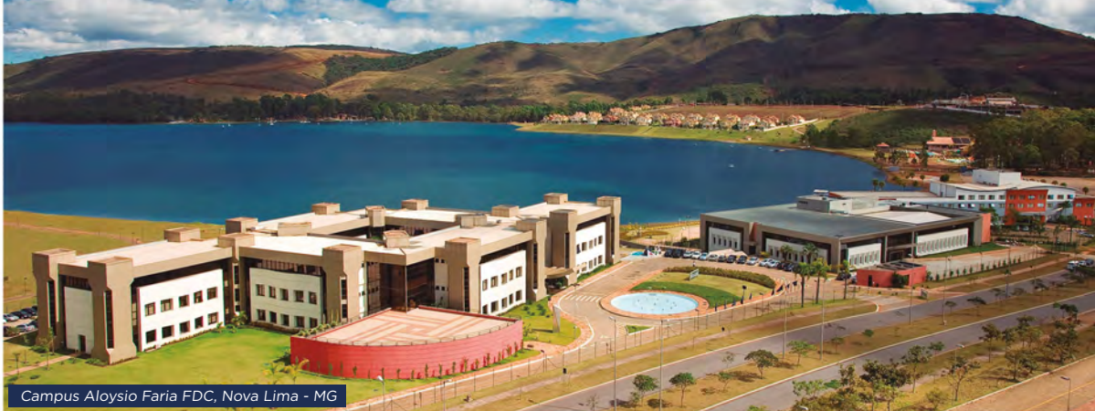
Campus Aloysio Faria FDC, Nova Lima - MG