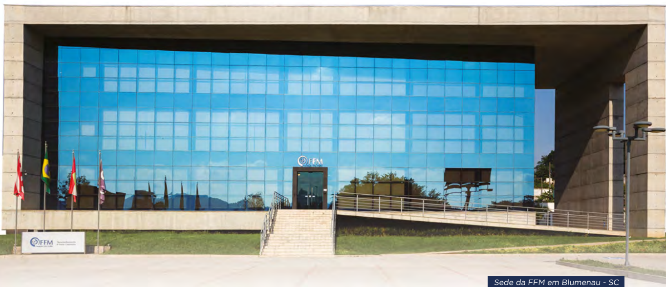
Sede da FFM em Blumenau - SC

Essa rede permite o acesso a modernas ferramentas de gestão, troca de experiências e geração conjunta de conhecimento.